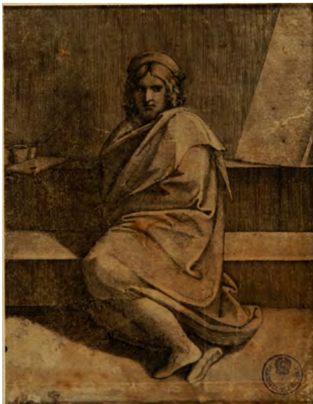
Marcantonio Raimondi Ritratto di Raffaello (c. 1520)

È quella corporeità che peraltro Formaggio non si limitava a teorizzare, ma praticava in prima persona nell'esperienza personale del gesto artistico, di pittore e di scultore 28 , che lo rendeva particolarmente sensibile al momento fattivo dell'artistico 29 .